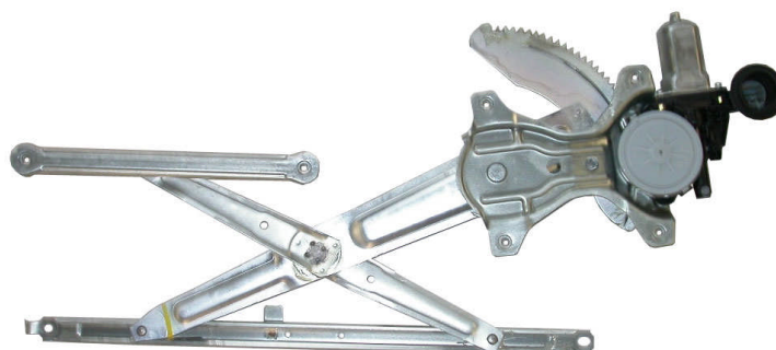
ORIGINAL POWER WINDOW LEFT ALZACRISTALLO ELETTRICO ORIGINALE SX